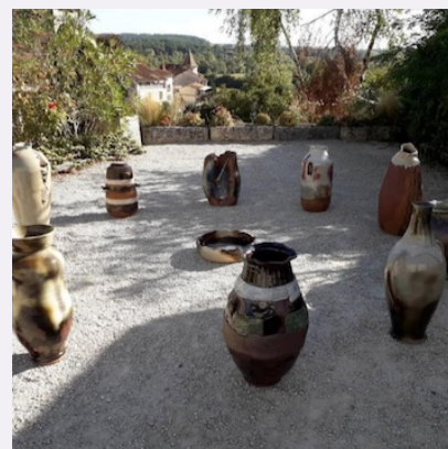
Installation créée par Dany Souriau