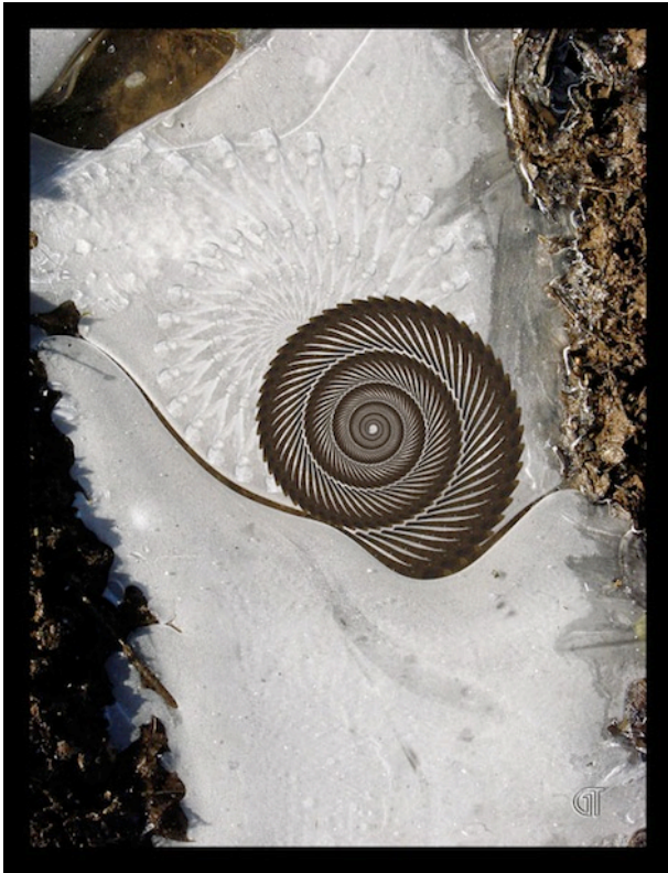
Georges Thaller, Eclipse

Le samedi 14 novembre à 16 heures, vernissage d'une exposition montée par l'imageur Georges Thaller . Tous les amis de la Librairie y sont cordialement invités !