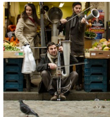
La Fausse Compagnie

17h00 La Fausse Compagnie , spectacle déambulante, Le Chant des Pavillons